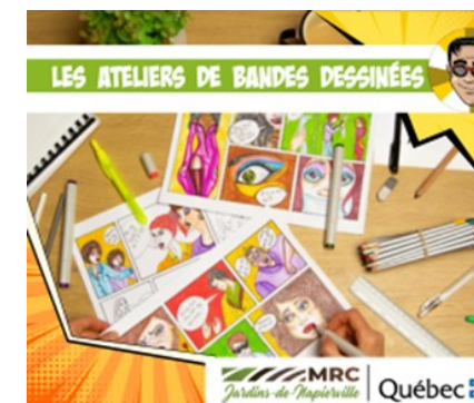
LES ATELIERS DE BANDES DESSINÉES MRC Jardins de Stépierville | Québec